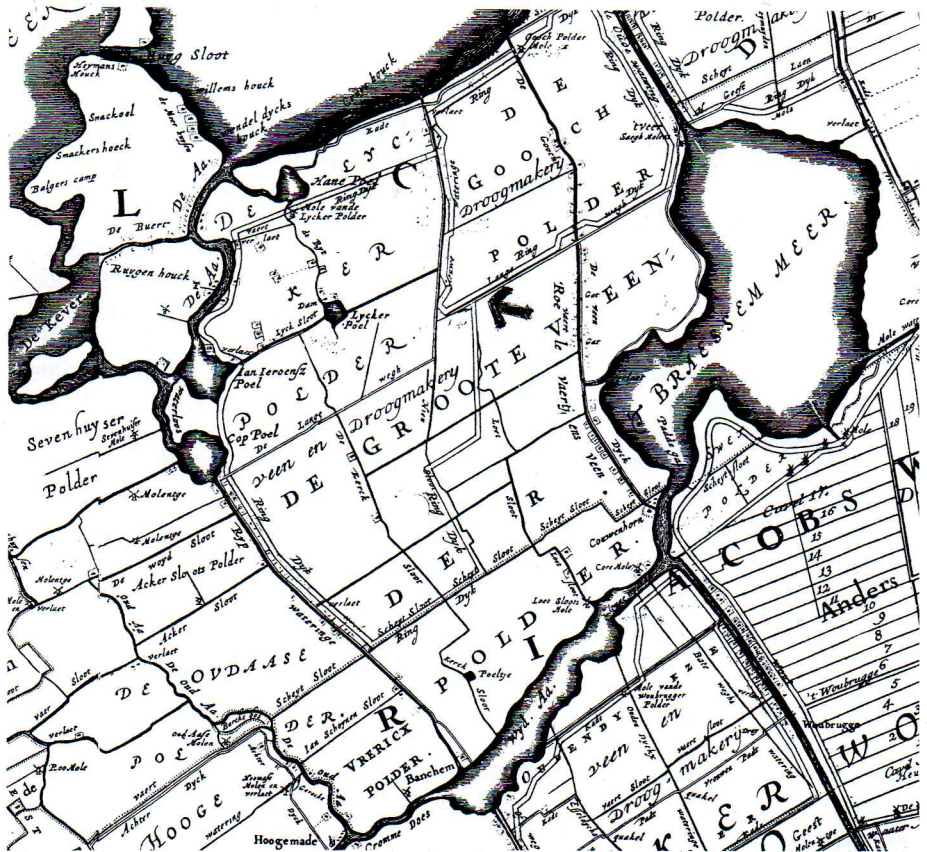
Alkemade 1746: Detail van de kaart van Rijnland getekend door Jan Jansz. Douw en Steven van Broeckhuijsen.

De keuze valt op de eerste variant: een brug in het midden van de weg. Of de lagere aanneemsom hieraan debet is geweest, is niet duidelijk, maar de draai met hun schip hebben vele schippers desondanks al die jaren veelvuldig kunnen maken.